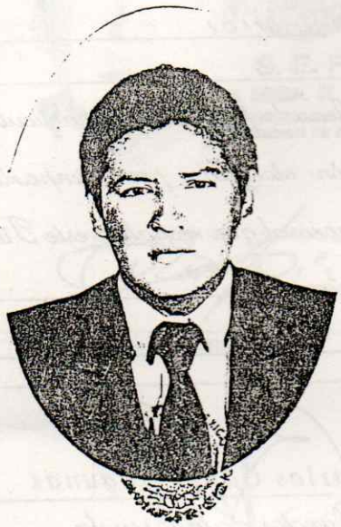
SECRETARIA EDUCATIVO NACIONAL

con el plan y programas de estudio autorizados y aprobó el examen profesional reglamentario.